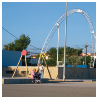
Montroig del Camp