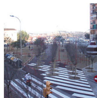
Sant Adrià del Besòs