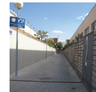
Premià de Mar