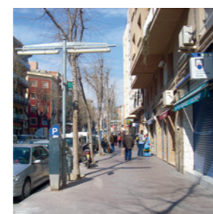
Santa Coloma de Gramanet